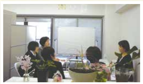
思いやりプロジェクト 副師長研修

組織の中で大多数を占める看護部が、第1陣です。看護部からメンバーを選出し、個人へ研修がスタートしました。看護部総出で、全職種への波及めざし、研修を重ねています。新年度に入り、外来部門のOJT研修も実施しております。