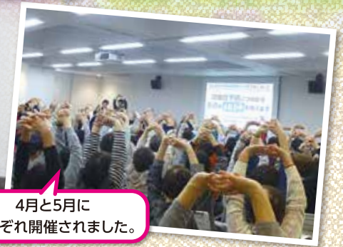
4月と5月に それぞれ開催されました。