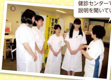
健診センターで健診業務の説明を聞いています

病棟・健診センター・薬剤室・検査室など、いろいろな部署で業務内容の説明を受けたり、病室のベッドメイキングや中央材料室でガーゼ折りなどを体験してもらいました。