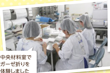
中央材料室でガーゼ折りを体験しました