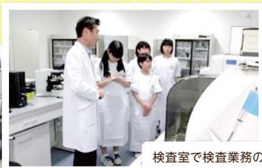
検査室で検査業務の説明を受け、要点をメモしています